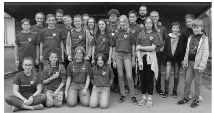
Auch nach drei Tagen Konficamp immer noch gut drauf!